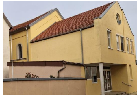
Kulturhaus, Schloßhof 13, 97320 Großlangheim

Bei den Führungen gibt es interessante Details von Zeitzeugen und aus der Chronik über das jüdische Leben in Großlangheim, das nicht vergessen werden sollte.